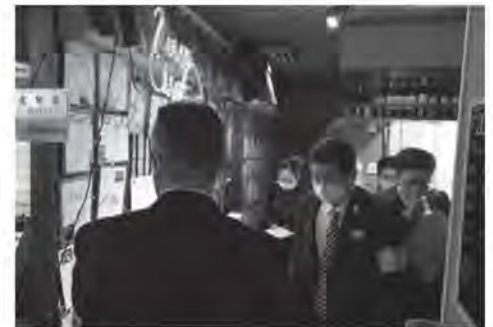
▲ステーキハウス四季本店