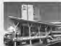
グッジョブ相談ステーション カフーナ旭橋A街区6階