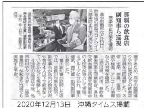
2020年12月13日 沖縄タイムス掲載