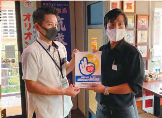
コロナ対策巡回指導 (P5)