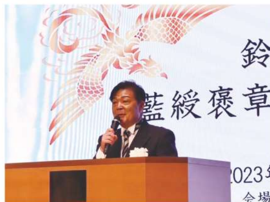
藍綬褒章受章記念祝賀会 (P6)