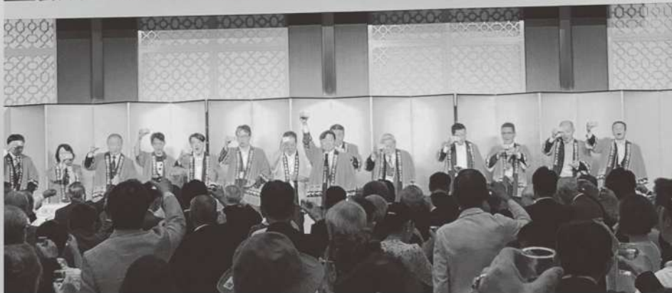
熊本県大会懇親会 乾杯の音頭