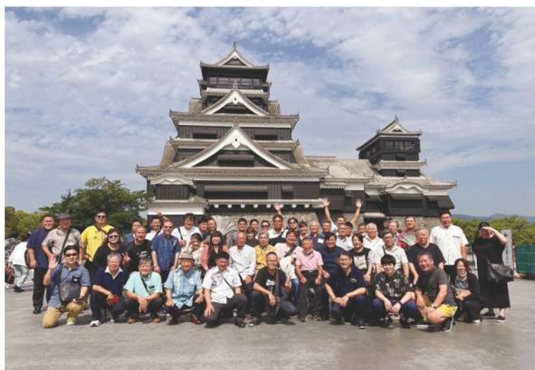
熊本県大会 (熊本城にて) P4