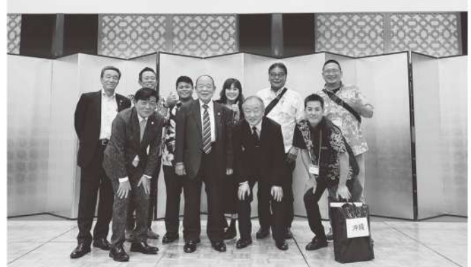
熊本県大会にて 八重山支部(左)と那覇支部(右)