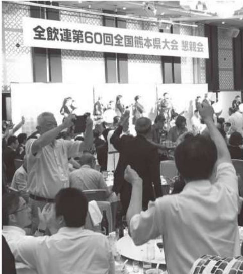
会場総立ちで「アリ乾杯」