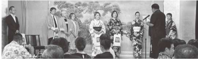
大会前日には山鹿の皆様のおもてなし ありがとうございました!